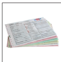
bis zu 8 Durchschläge